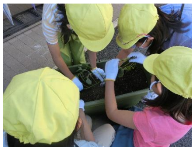
さつまいもの苗植え