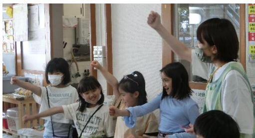
だいごポストの発表