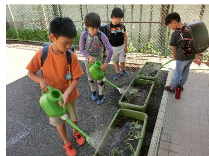
帰ってきたらお水やり

3年生は毎日なにかしらのお仕事が・・・でも、活動をとても楽しんでくれています♪♪