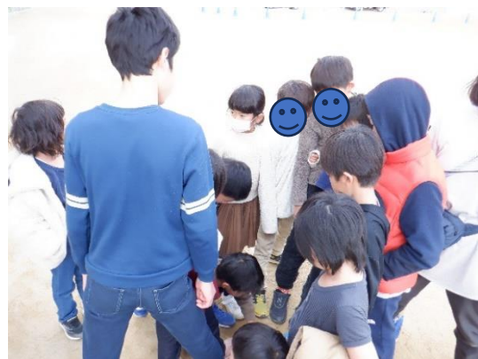
「けいどろ」みんなで鬼決め！

子ども会議に参加した6年生が「みんなでおもしろいことしよう！」と企画。 12月27日と1月6日に1年生から6年生までの、たくさんのお友達と一緒に「けいどろ」楽しみました！