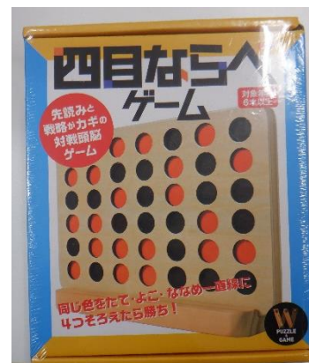
『四目ならべゲーム』