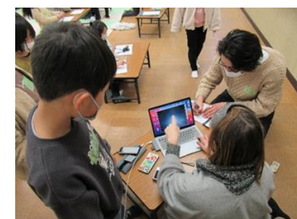
ぼくはこの作品で応募するよ