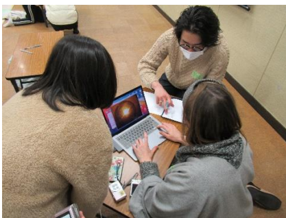
先生この作品どう？