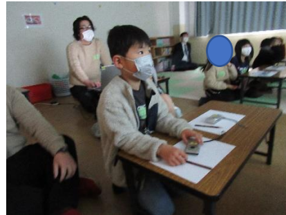
みんな真剣に聞いているよ