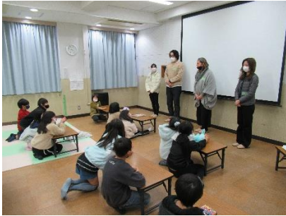
京都グラフィックのみなさん