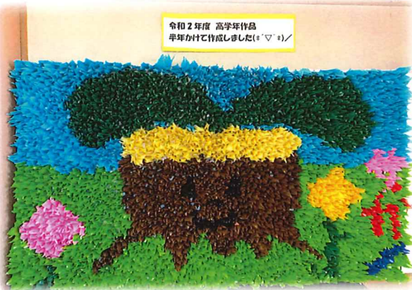
作品は図書室に飾っています!!

コロナ禍の中、子ども達が世界中の人の安心安全を願って「つる」を毎日こつこつ折って仕上げた大作です。 是非、見に来て下さい!(約2000羽作成)