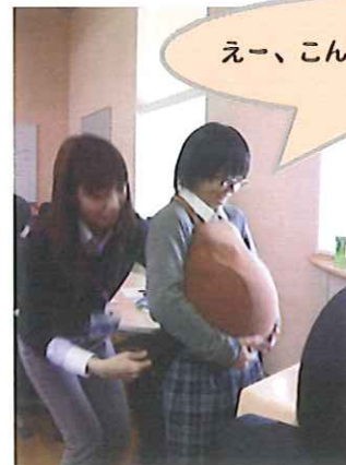
妊婦体験で胎児の重みを実感

11月26日(月) いよいよ赤ちゃんとお対面！初めは緊張気味でしたが、赤ちゃんのかわいさに自然と笑顔がこぼれます