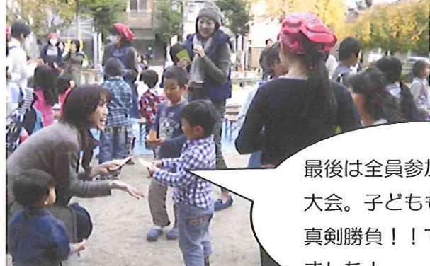
最後は全員参加のジャンケン大会。子どもも大人も真剣勝負！！で盛り上がりました！