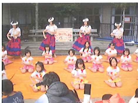
華やかなフラダンスでおまつりがスタート！！

学童クラブ・乳幼児クラブの保護者の皆様、地域の皆様、ボランティアの皆様には準備から当日の運営まで大変お世話になりました。本当にありがとうございました。