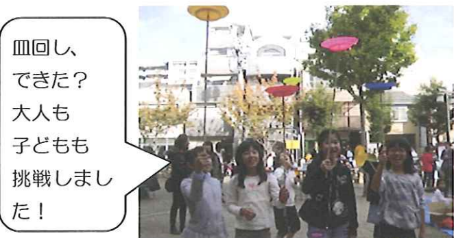
目隠し、できた？大人も子どもも挑戦しました！