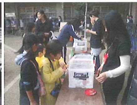
コインおとし！何度もチャレンジ！