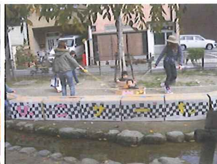
乳幼児さん向けちびっこサーキット♪