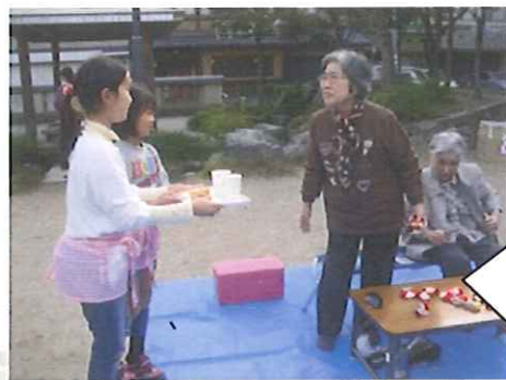
カフェのスタッフが飲み物とお菓子を届けます！「お待たせしました～！！」