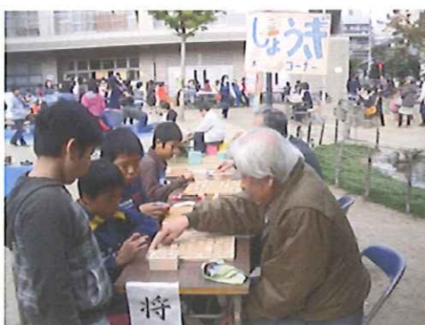
将棋コーナー勝負を挑むもなかなか勝てません・・・