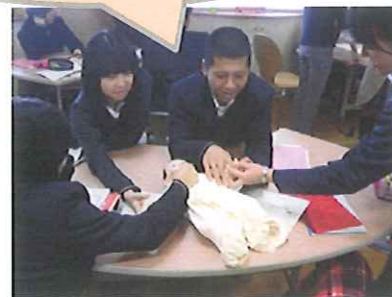
赤ちゃん人形と触れ合いながら想いをめぐらせます・・・