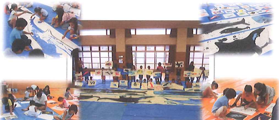
みんなが描いた魚を切り貼して、児童館の壁や天井が水族館になりました~♪

修徳自治連合会まちづくり委員会と京都府建築士会の方々に協力をしていただき、せんだんホールに幼児さんから大人までが集まり、床に大きな紙を広げ、絵の具やクレパスで魚の絵をいっぱい描き、思いっきりお絵かきを楽しみました。