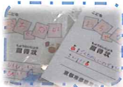
～招待状・プラバン作り&お宅訪問～