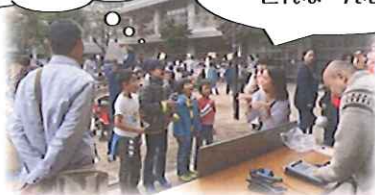
ジェスチャーゲーム