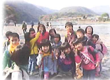
桂川のほとりにて