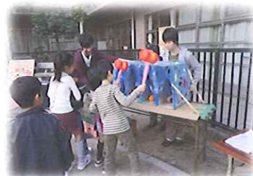
中高生によるさめばっちゃんのコーナー