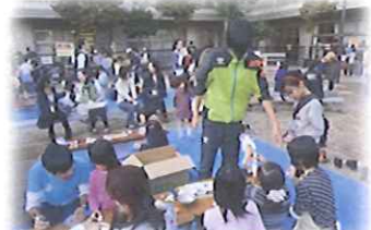
スイーツキーホルダー