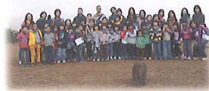
おサルと一緒に記念写真