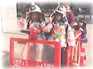
ミニ消防車コーナー