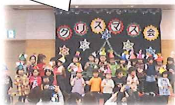
すずかヤスタネットを鳴らしました