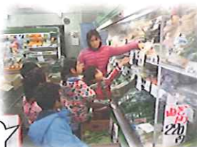
ピザの材料を買いに松原商店街へ…