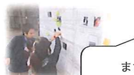
まち歩き地図の完成!! たくさんの発見を地図に書き込みまし