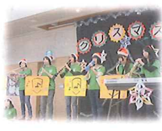
ハッピーワンダーランド コンサート