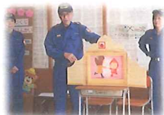
消防分団のみなさんによる紙芝居

まち歩きの後は、ピザづくりをしました。乳幼児さんからおとなまでが協力して、野菜をきったり、ピザ生地をのばしたり…段ボール箱でつくった窯で、とてもおいしいピザが焼きあがりました。