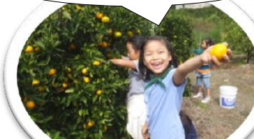
山城多賀フルーツライン