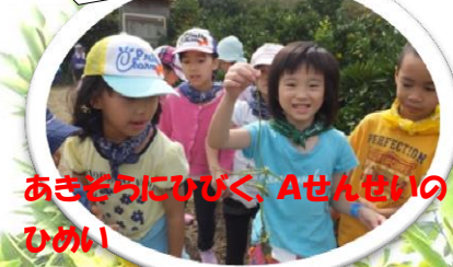
あきどらにひびく、Aせんせいのひめい