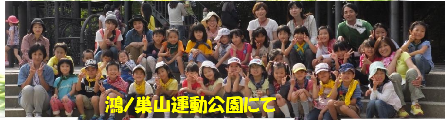
鴻ノ巣山運動公園にて