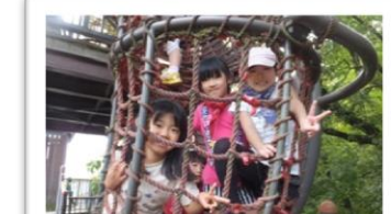
鴻ノ巣山運動公園