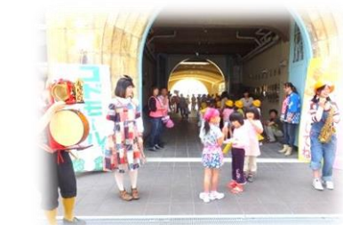
コドモ音楽隊が会場を盛りあげる♪