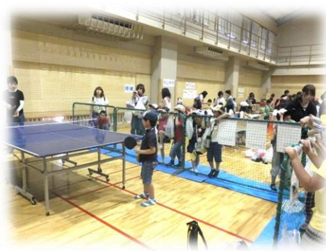
中高生に挑戦！卓球コーナー。中高生も本気！