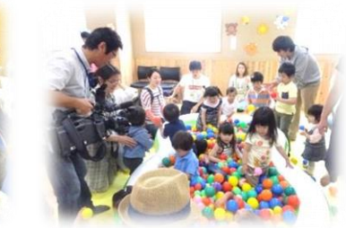
ちびっこさんたくさん！テレビ取材もきました。