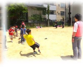
とべ！スリッパとばし