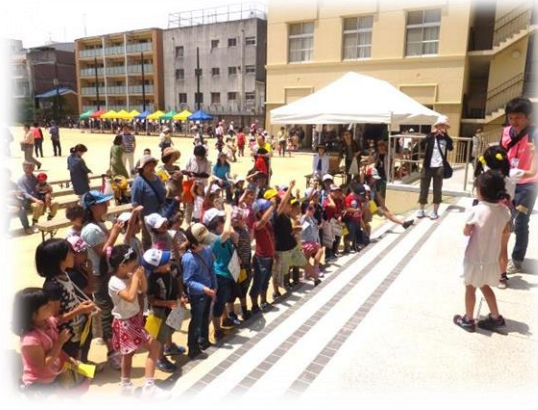
下京ひかり児童館の子とが司会をつとめました。子どもたち考案のジャンケン大会なども。