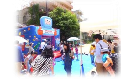
グラウンドには巨大ふわふわドームが登場★