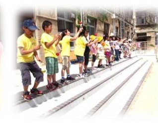
飛び入り参加ありのけん玉ステージ