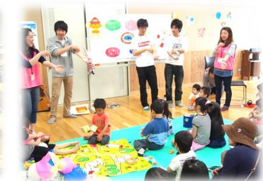
ちびっこらんででは中高生の手遊びや読み聞かせも。