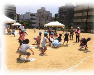
みんなでお戦！大型オセロ