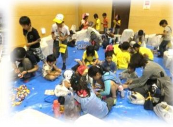
3階はしごやダンボール迷路など盛りだくさん！