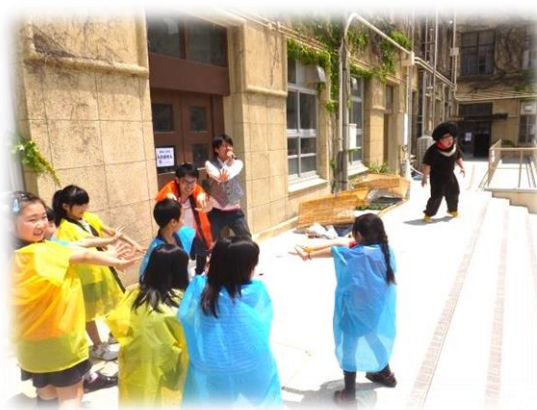
修徳児童館の子とNPO法人フリンジシアタープロジェクトのみなさんによるオープニングアクト

たくさんのステージ参加ありがとうございました！ うきうき0B、てく・ぴゅんのお友達もありがとうございました！