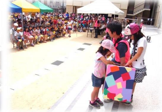
最後は大抽選会をしました！