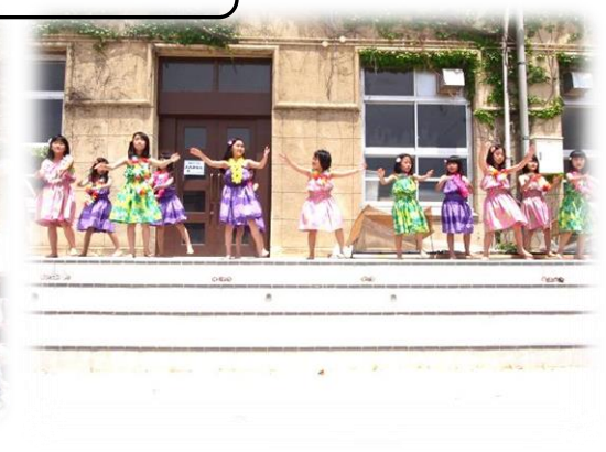
こどもフラダンスクラブによる発表♪