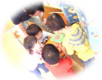
みんなで かんさつ★

育成室ではもってきたごはんを 食べたり、100円でおかわり自由！ シュートクカフェもあります。