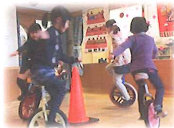
一輪車、いろんな技ができるようになったね♪