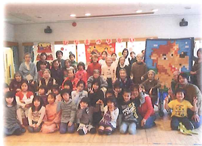
司会をしてくれた4年生の2名の女の子、 見に来てくださった皆様、ありがとうございました。