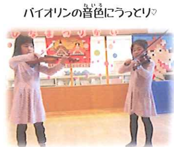
バイオリンの音色にうっとり♡