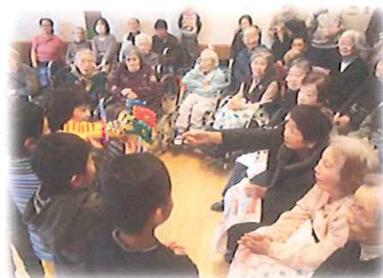
ラキューで作ったドラゴンを見せてまわりました。 「上手だね〜」との声に得意げなこどもたち!