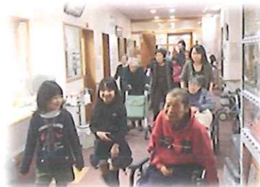
おじいさん・おばあさんに・・・ みんなで作ったモザイク壁画をプレゼントしました!