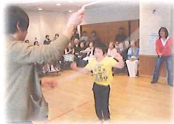
飛び入り参加のダブルダッチ! 失敗しても何度もチャレンジ!