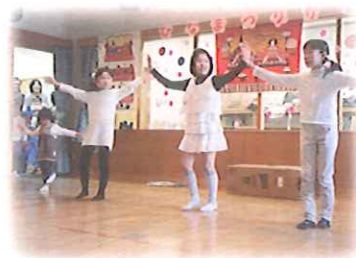
衣装も合わせて 肩ピッタリのダンスを披露