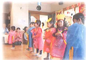
うきうきクラブのおともだちに よるかわいいダンス♪

1年のしめくりに自分の得意なことや好きなことを発表する場として、今年もひなまつり発表会を行いました。ダンスやマジック、キーボード、皿まわし、一輪車、日本舞踊など、この日のためにそれぞれが準備や練習をしてきた成果を出し合いました。