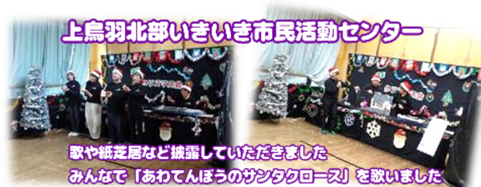
上烏羽北部いきいき市民活動センター