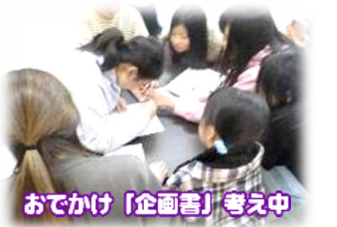
おでかけ「企画書」考え中