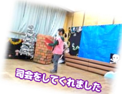
司会をしてくれました