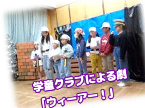
学童クラブによる劇 「ウィーアー！」