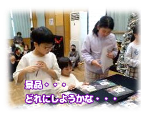
景品・・・ どれにしようかな・・・