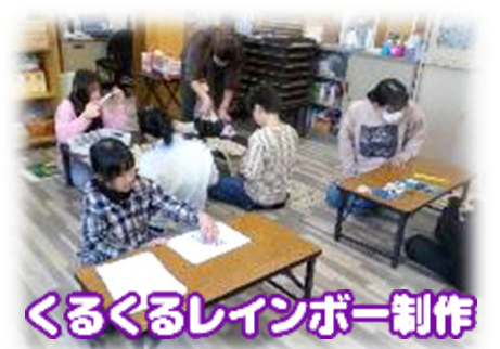
くるくるレインボー制作