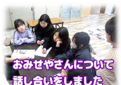
おみせやさんについて 話し合いをしました