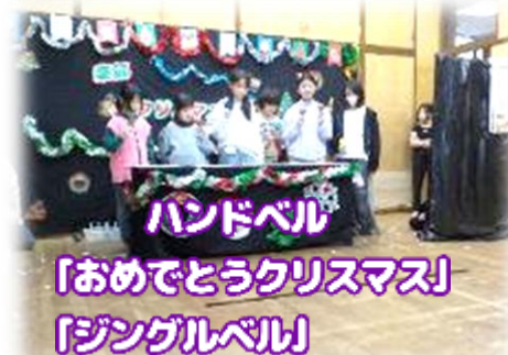
ハンドベル 「おめでとうクリスマス」 「ジングルベル」