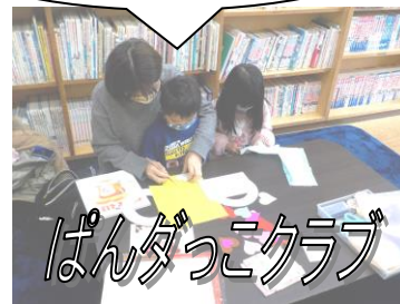
ぱんだっこクラブ